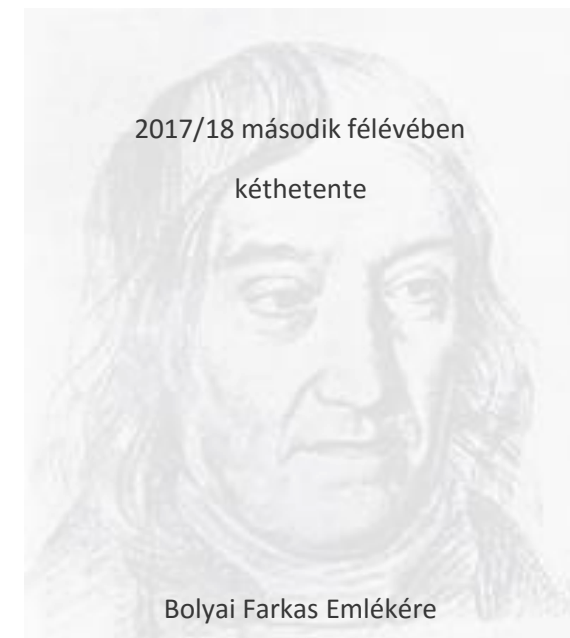
Bolyai Farkas Emlékére